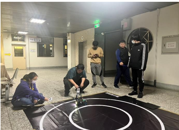
車道與標誌偵測實作